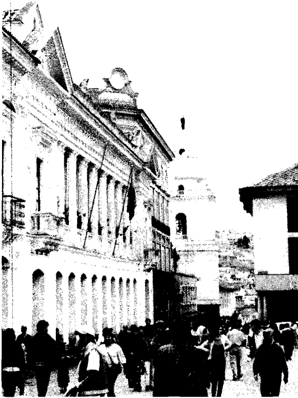
Zona peatonal en el centro histórico de Quito