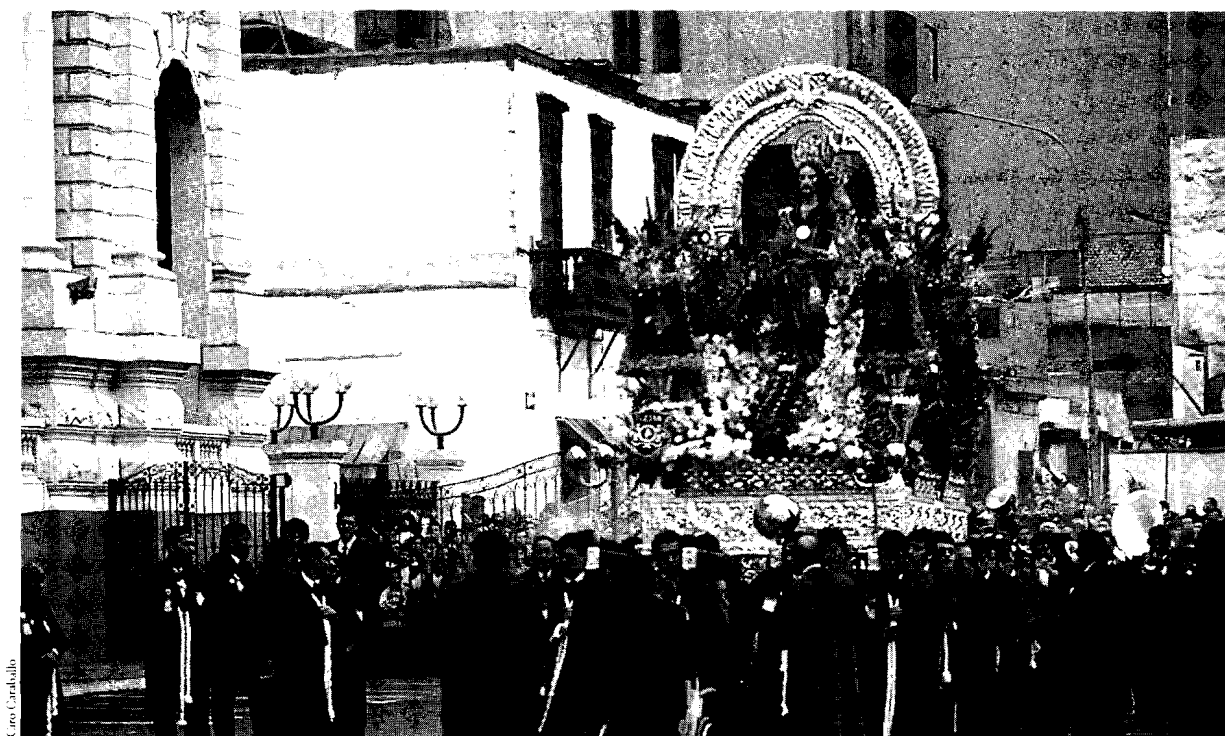
Procesión en Lima

pero sin lugar a dudas de propiedad privada en casi todos los países. Estos bienes fueron concebidos como objetos de culto y por ello sujetos a las transformaciones que éste demanda. El Estado ve los bienes de la Iglesia como objetos culturales y, por lo tanto, establece un estricto control por parte de los organismos patrimoniales, fuente de conflictos que obstaculizan el desarrollo de acciones comunes. La Iglesia, por su parte, requiere de la participación del Estado para el mantenimiento y restauración de edificaciones y de los objetos religiosos, viéndose atrapada así en el dilema del propietario arruinado: tiene que vender el santo para salvar la limosna. No deja de ser importante la búsqueda de salidas novedosas al tradicional conflicto. La Iglesia Católica latinoamericana debe asumir un papel activo en el proceso de recuperación que esa herencia cultural juega en el nuevo proceso de evangelización, siguiendo las orientaciones papales contenidas en la