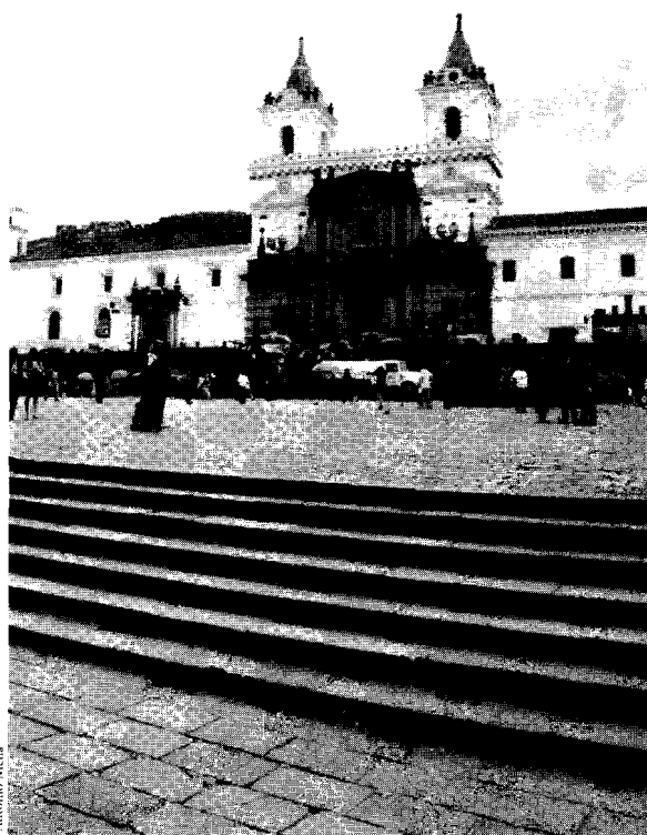
Plaza de San Francisco, Quito

La acción sostenida de individuos y grupos preocupados por la conservación del patrimonio urbano ha revertido, aunque parcialmente, la tendencia a su abandono y destrucción. Esfuerzos iniciales por preservar monumentos aislados, amenazados por la renovación urbana, han evolucionado hacia una acción más concertada del Estado para legislar en favor de la protección patrimonial y destinar recursos públicos para proteger los ejemplos más destacados del patrimonio. Así, en la actualidad, la mayor parte de los países de América Latina y el Caribe cuentan con alguna forma de legislación de protección del patrimonio urbano y de intervención pública y privada en su favor. La situación más común asigna al Estado la mayor parte de la responsabilidad de protección, relegando al sector privado a un papel de demandante de intervenciones o de colaborador